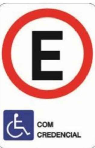
SINALIZAÇÃO VERTICAL VAGA PNE

ESPECIE: Araçá PORTE: Pequeno Ø MÉDIO TRONCO: 0,25m Ø MÉDIO COPA: 4,00m ÁREA DO CANTEIRO: 2,08m²