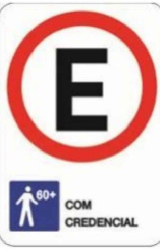
SINALIZAÇÃO VERTICAL VAGA IDOSO