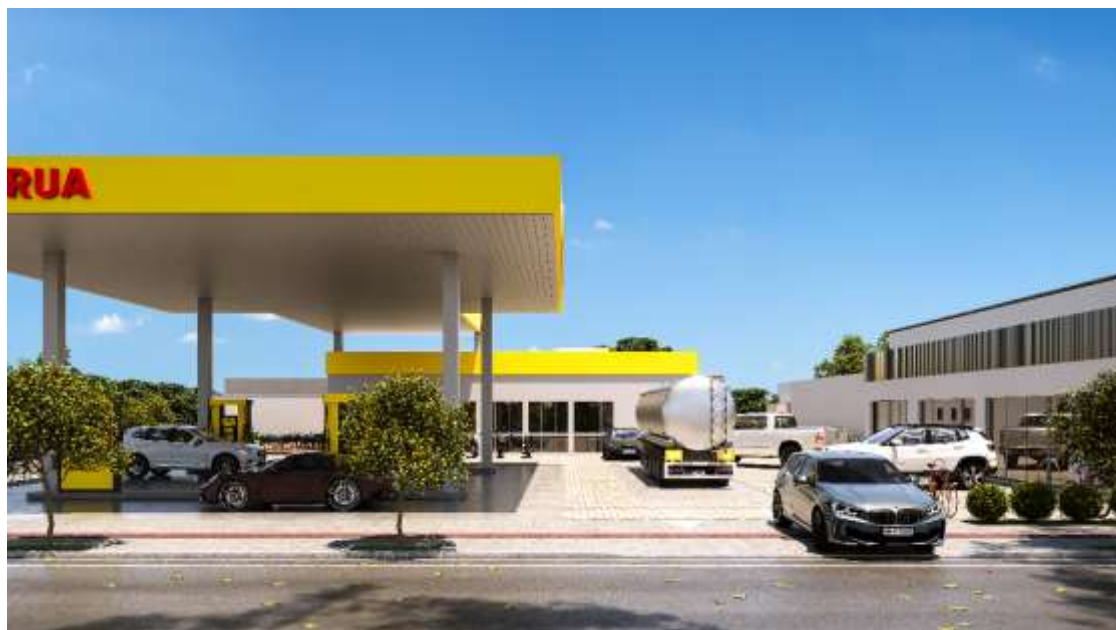
Figura 89.2: Representação da integração do espaço público e privado do empreendimento, no passeio e paisagismo, do empreendimento.