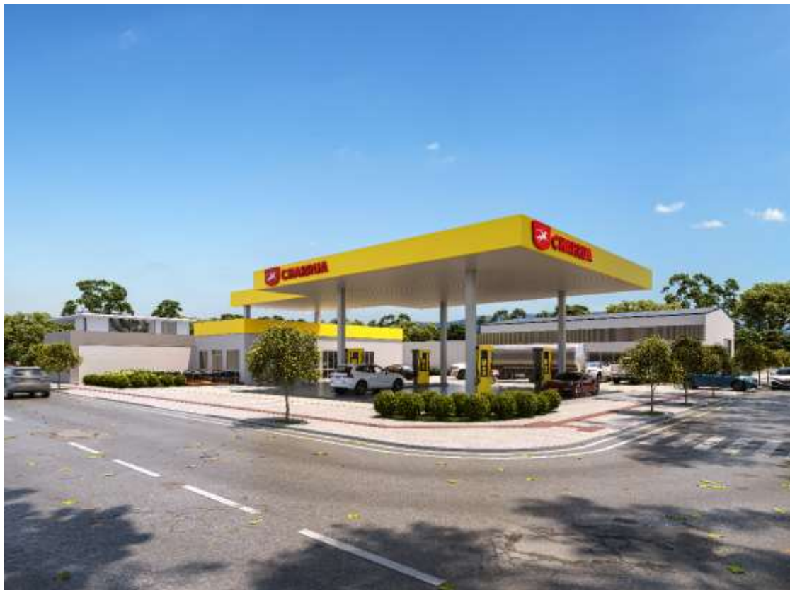
Figura 89.1: Representação da integração do espaço público e privado do empreendimento, no passeio e paisagismo, do empreendimento.