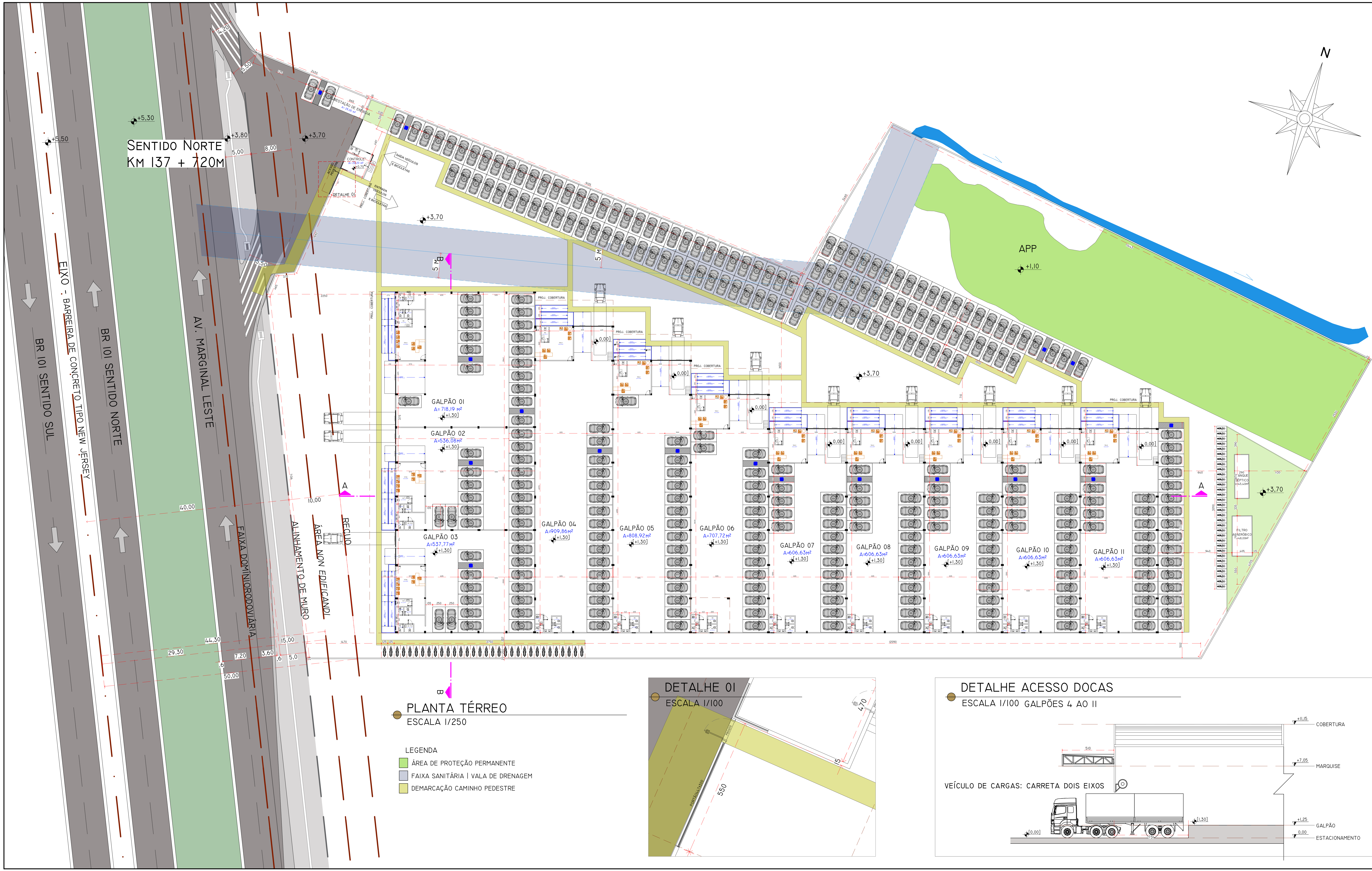
PLANTA TÉRREO ESCALA 1/250