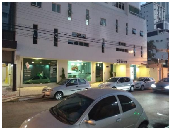
CARACTERÍSTICA DO ENTORNO