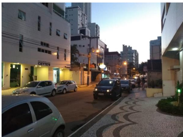
CARACTERÍSTICAS DO ENTORNO