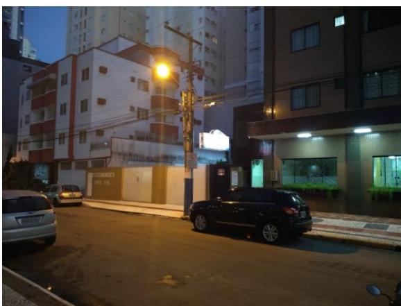
CARACTERÍSTICAS DO ENTORNO