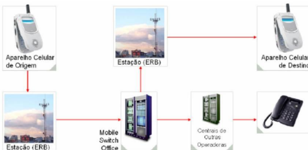
Sistema de Telefonia

Cada ERB funciona integrada a um conjunto de outras ERB'S interligadas a um Remoto Switch Office (RSO) e, por sua vez, interligadas com as centrais telefônicas convencionais. Assim é definido um sistema de telefonia, onde os componentes são interdependentes.