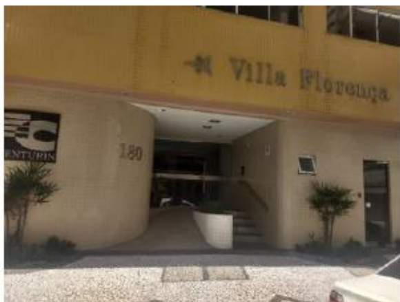
VISTA FRONTAL DO EDIFÍCIO DE INSTALAÇÃO