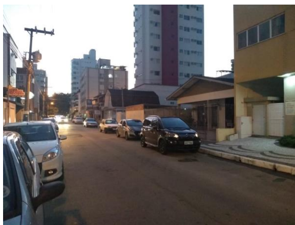
CARACTERÍSTICAS DO ENTORNO