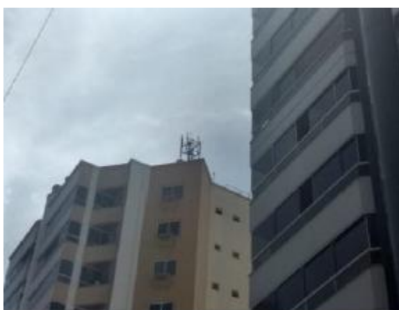
VISTA DA ERB INSTALADA