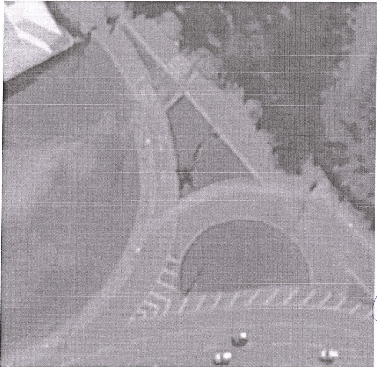
Encaixe Rua Aqueduto à Av. das Flores.