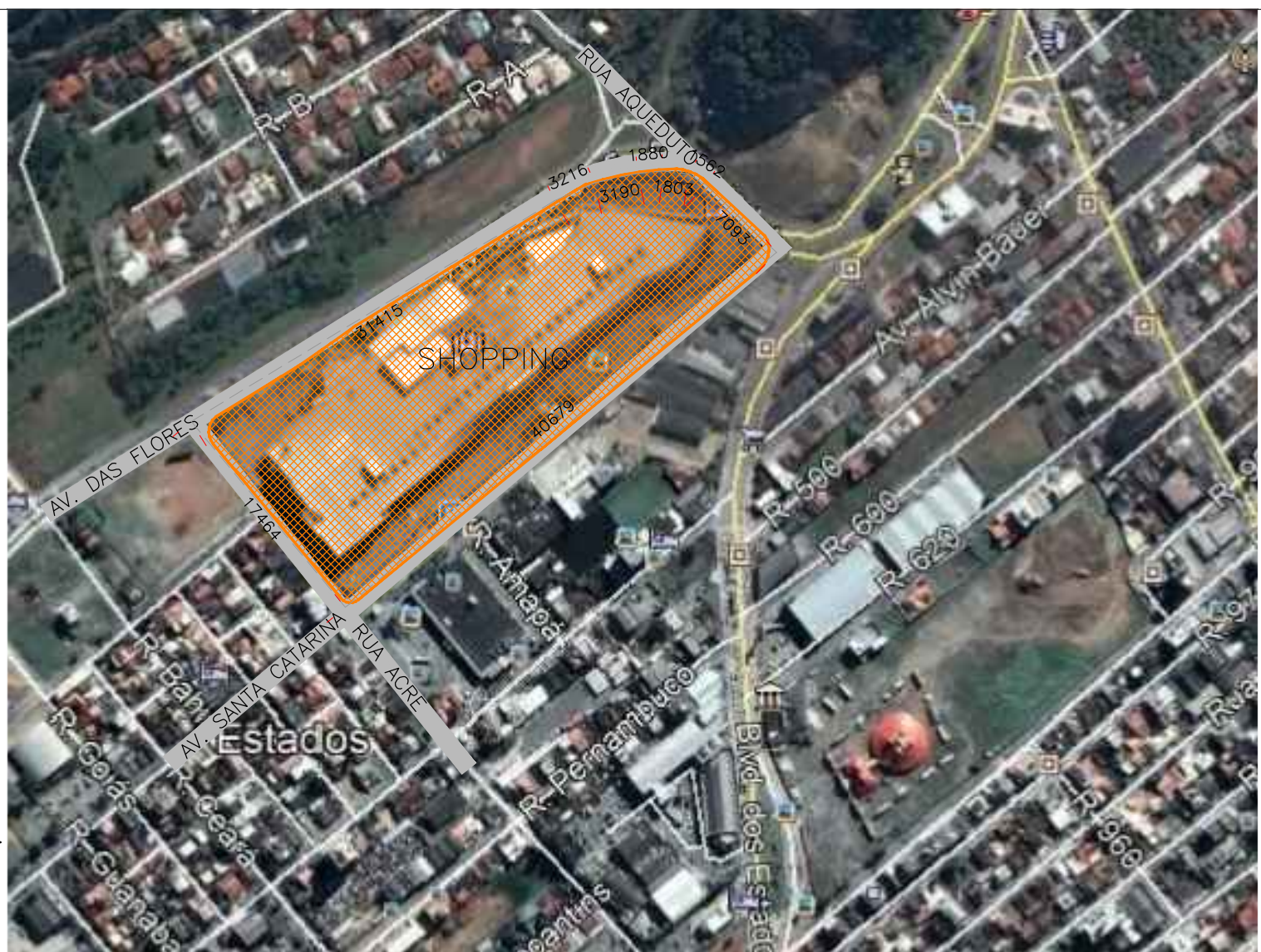
01 PLANTA SITUAÇÃO ESC. SEM ESCALA