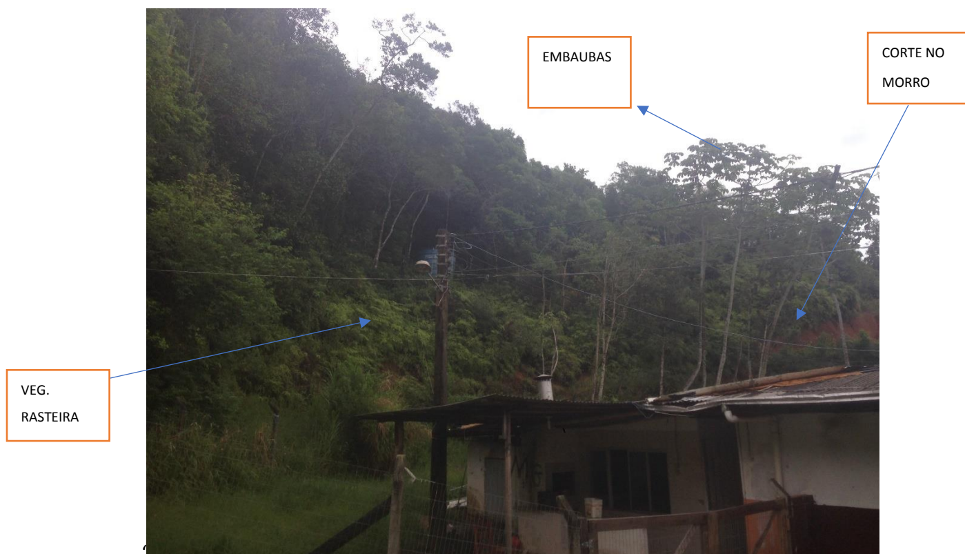
Figura 8 – perfil da mata

Notamos a presença de plantas rasteiras no início das declividades, o que caracteriza de certa forma uma regeneração natural e que possa já ter se consumado o impacto ambiental.