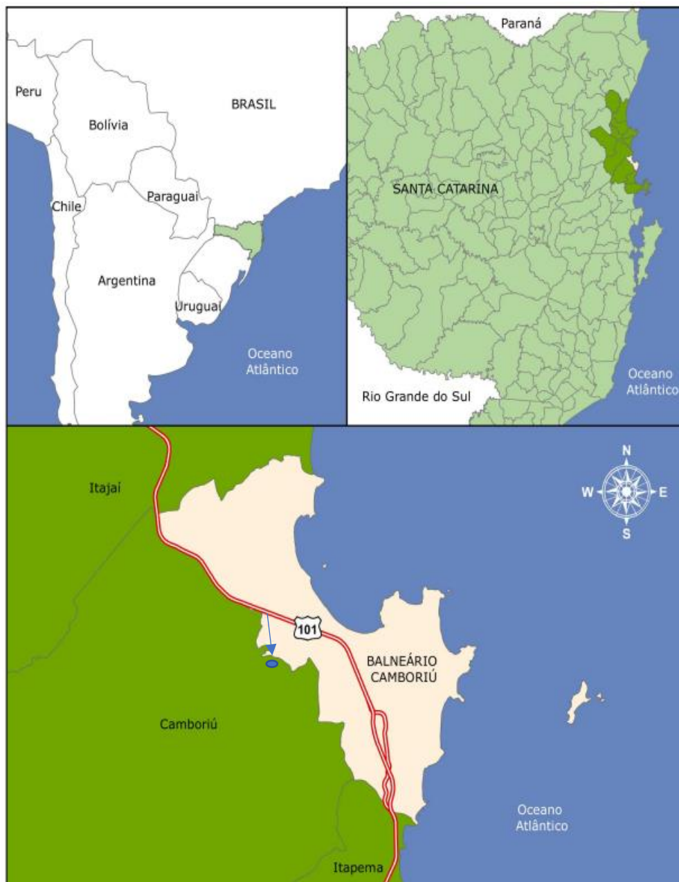
Figura 2 – Localização detalhada