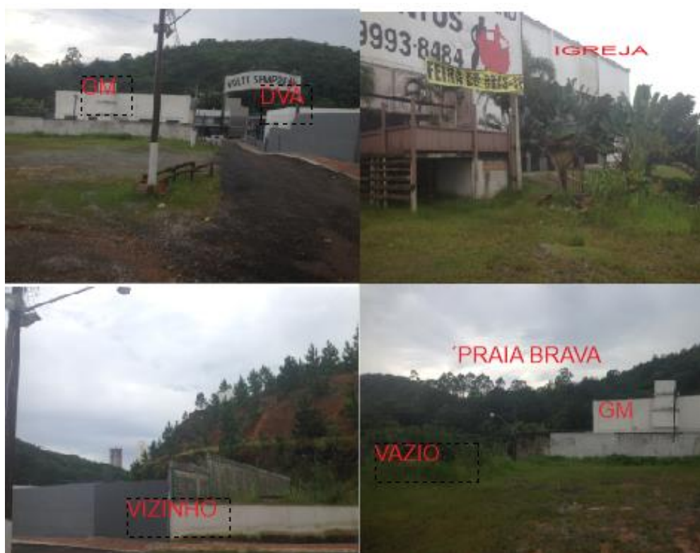
Figura 10 – vizinhança raio 500 metros

Todos os estabelecimentos comerciais tem o fim das suas atividades após as 19 horas, em ambos os lados da avenida dos estados, a igreja Bola de Neve tem horários específicos de funcionamento que em vezes coincide com inicio das atividades do estabelecimento Galpão serrano, quando um inicia as atividades terá coincidência de horário de pelo menos 2 horas .