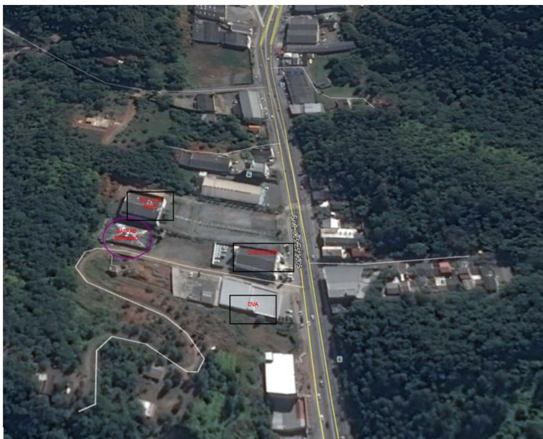
Figura 1-Local do empreendimento e as Vias de acesso ao empreendimento

Na sua fase de implantação foram obedecidas as normas brasileiras de segurança e de proteção ambiental. Os cuidados que vêm sendo tomados desde a