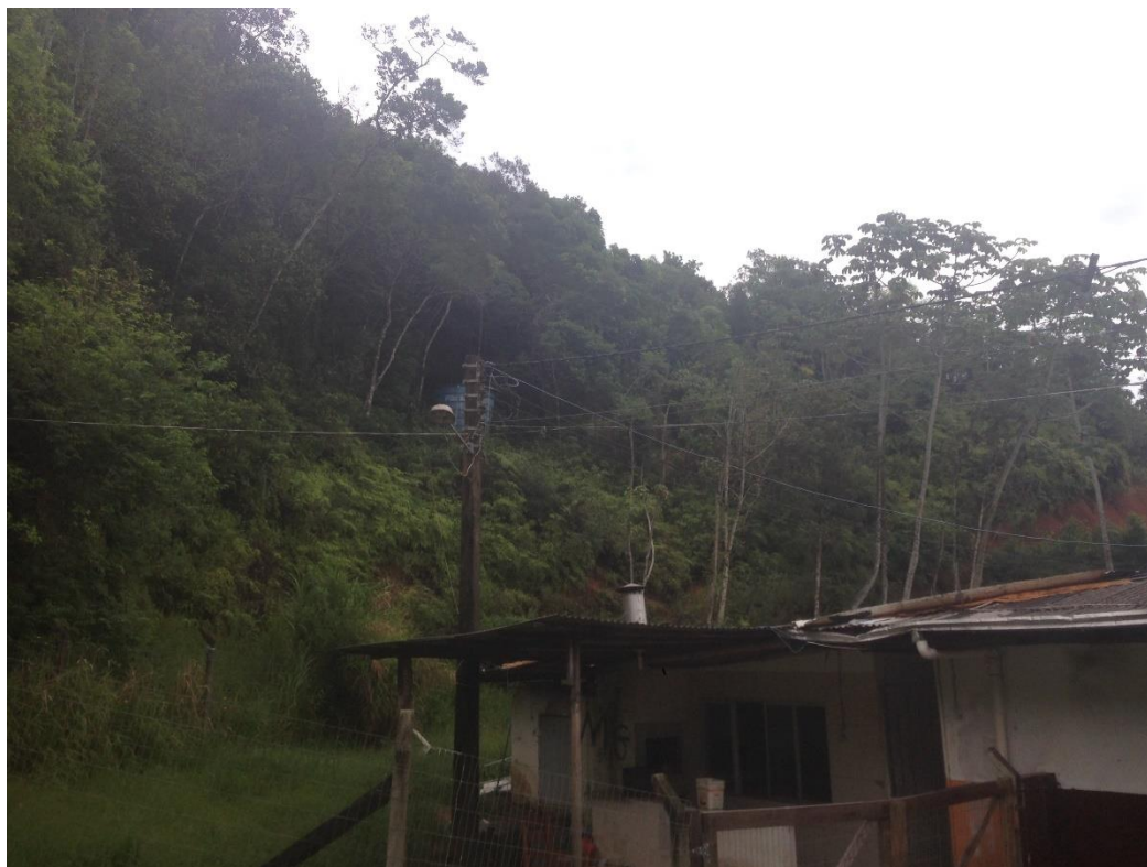
Figura 5- proximidade da casa com área de preservação

Os processos geológicos de superfície , estão sob controle porém existe estrada aberta na parte sul e norte da propriedade , que estão sem manutenção causando riscos de desabamento e escorregamento de terra.