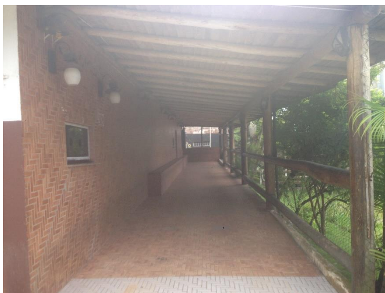
Figura 3 -Local de entrada do empreendimento

O acesso é amplo e coberto com espaço suficiente para abrigar todas as pessoas que eventualmente estão aguardando, neste local estão protegidos das intempéries e em segurança com relação aos outros estabelecimentos.