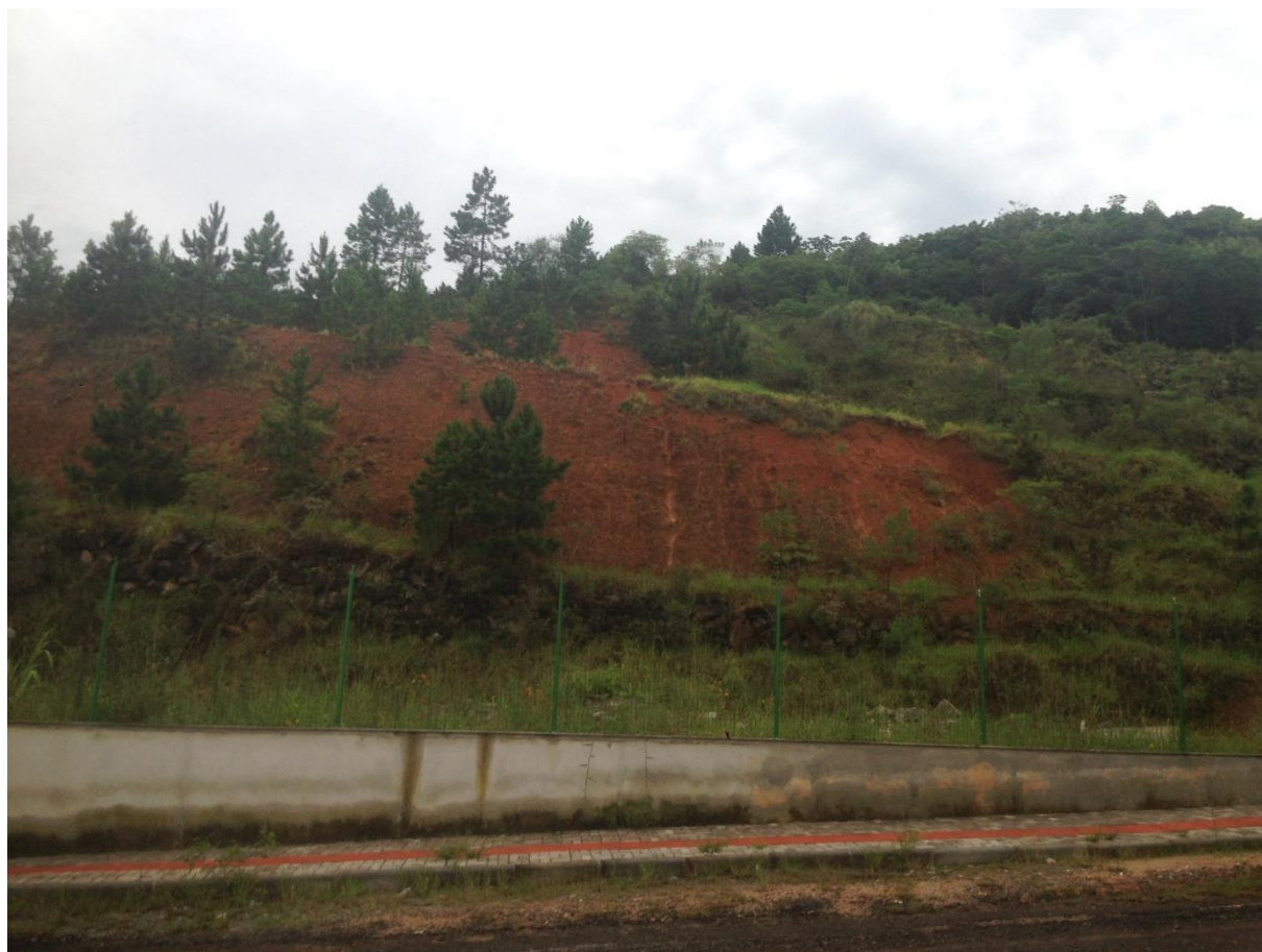
Figura 4 – visão lateral da mata

A mata junto ao estabelecimento, em inclinação superior a 45 graus , sendo vedada qualquer tipo de corte, manejo ou habitação não autorizada previamente pelos órgãos ambientais responsáveis.